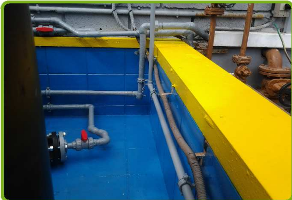
Impermeabilizado Interior de un cubeto con Poliuretano