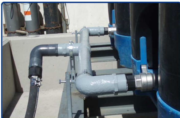
Diseño a medida de Conexión en "T" de PVC con fibra de Vidrio