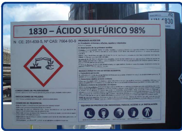
Diseño y Suministro de Carteles a medida